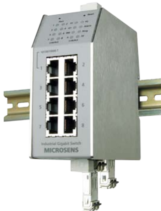
Ring Switch Gigabit Ethernet 10 ports avec SFP

Le système de télésurveillance couvre au total 8 sous-stations du pipeline éloignées de parfois jusqu'à 100 km. Il est fondé sur les switches industriels Fast Ethernet MICROSENS avec des ports fibres redondants, permettant une structure en anneau, et, en cas de panne sur une liaison ou d'un composant, une cicatrisation de l'anneau en moins de 100 ms. L'accessibilité continue de tous les utilisateurs est garantie. Au terme de plusieurs mois de travail dans le désert dans des conditions difficiles, les stations ont pu être interconnectées avec succès et le réseau présente désormais une grande fiabilité et permet une supervision à distance.