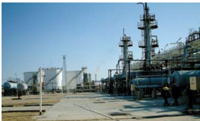
Raffinerie dans le désert du Turkménistan. Pour ce projet, les composants doivent être robustes et fiables

C'est pour cette raison que le gouvernement initie de nombreux projets internationaux de construction de gazoducs et oléoducs. Ceux-ci conduisent à travers l'Iran vers la Turquie, mais aussi à travers l'Afghanistan vers le Pakistan, jusqu'en Chine et au Japon. Déjà en 1994, le gouvernement signait un accord avec l'Iran pour lancer le projet de gazoduc «Turkménistan – Iran – Turquie - Europe».